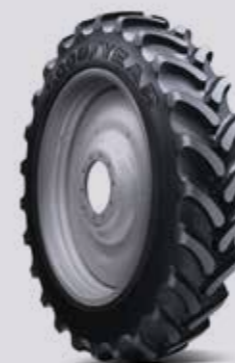
ULTRA SPRAYER R-1